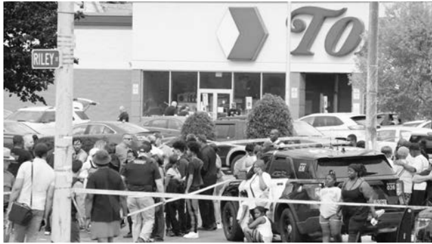
水牛城（Bufflo）——Tops超市內外的槍擊案

靜心去。想到也就是在10天前，發生在紐約水牛城（Bufflo）——Tops 超市內外的槍擊案，也是由一名為佩頓·根德