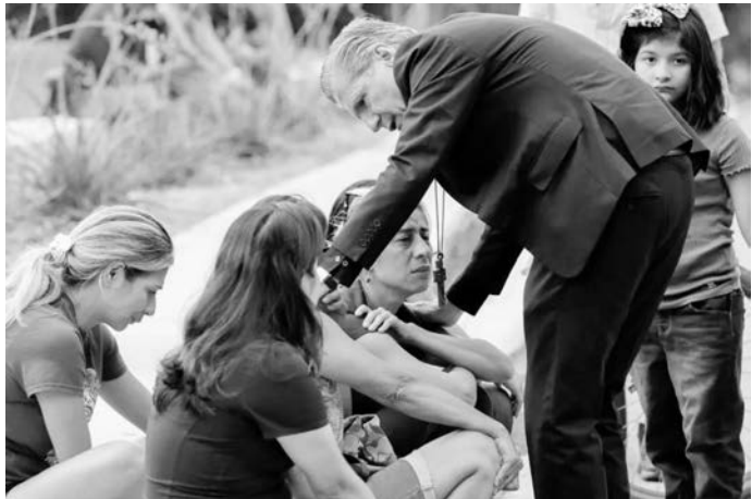
一位神父在安慰驚恐未定的羅布小學的學生和家長

這一 似乎已經 是美國社 會「平常 新聞」的 突發事件 讓我難過 了很久， 連祈禱默 想都無法