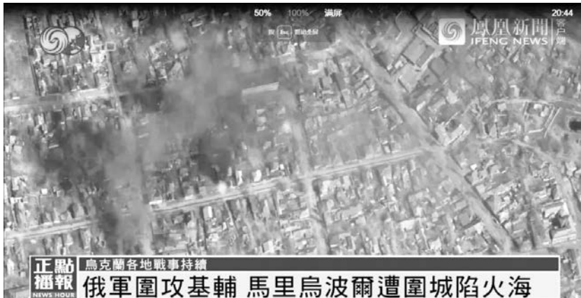
俄軍圍攻基輔 馬里烏波爾遭圍城陷火海

我感受到了拜登總統內心的痛苦、憂傷和憤怒。有那個正常人不會如此呢？我本人也整個早上悲哀難過得不想幹其它事情，最終決定寫點什麼來表達某種說不清道不明的情緒。不過，有一點是清楚的：發生在美國的槍擊案，不論是過去的還是現在的，也不論是在校園還是在其它貌似安全普通的生活、娛樂、工作等場合，都是令人沮喪、悲哀和難過的，但，發生在世界其它地方的暴力和戰爭，如依然在肆虐中的俄烏戰爭，同樣該讓有良知的正常人問上述拜登對著鏡頭向國民問過的那幾個問題：我們什麼時候能因着神的名義，消滅大規模殺傷性武器，停止軍備競賽，分享天賦的生命和資源呢？——且不說以「神的名義」來發動戰爭了！早在距今約 2700 年前，以色列的依撒意亞先知就這樣在神視中預見說，「眾人都把自己的