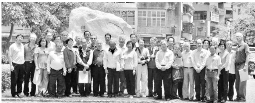
2010.5.1 在新竹社服中心舉行「杜華神父逝世20周年紀念感恩活動」合影

杜神父的言行舉止，在潛移默化中，深深的影響我們，堅守自己的信仰崗位，衷心依靠天主，杜華神父的精神永遠長存！❖