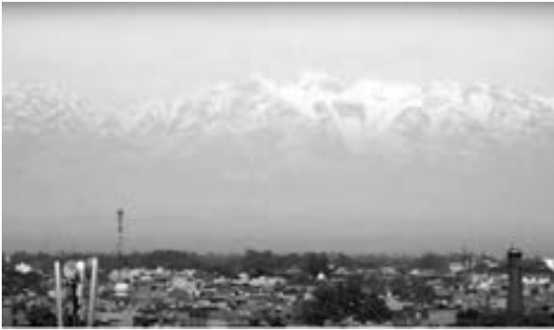
印度的天空出現了希瑪拉雅山

踢農人辛苦耕耘的莊稼「如果我們愛大象，大象也會愛我們」彷彿香格里拉之境界，共享天主造化大自然的無私餽贈。因此，