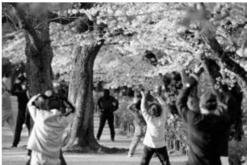
戶外散步、運動10~20分鐘即可補充維生素D。

因為防疫在家造成的活動量降低，也導致許多長輩的肌肉量減少、行走步態不穩、容易疲累等，如果加上蛋白質攝取量不足，恐提高罹患肌少症的風險；另一方面，減少運動以及食用過多加工食品、飲料與甜食造成的熱量過多，則容易造成肥胖、腸胃不適、血糖、血壓、血脂過高等健康問題。所以防疫