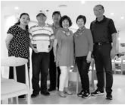
音樂會後兄弟姊妹的聚會