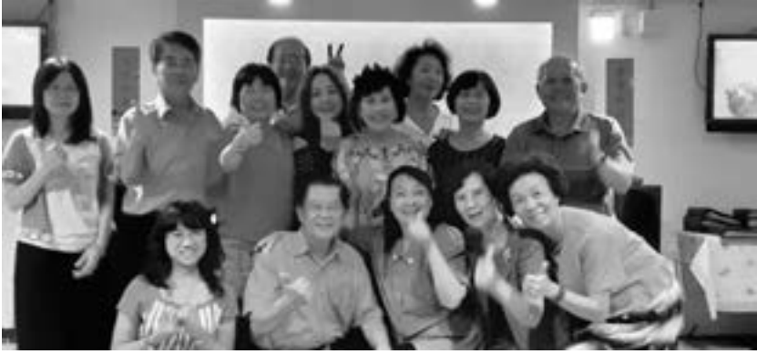
參與歡唱的好朋友們

了。因此要常常聚會是件不容易的事了。趁年輕大家健在時，小聚交談變成我們三、四十年代的課題了。要把握現在。