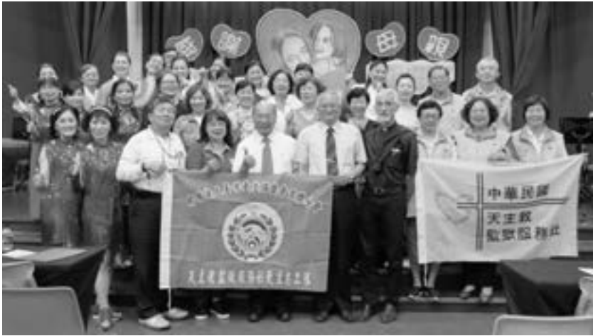
監牧志工及社區志工表演者合影

人、或詐欺收容人、……因應不同工場的收容人，課程變換就又增加一些法律常識，讓收容人假釋或回家以後，能有專業的技能工作學習等，多樣的課程，有時我們就擔任陪同者。