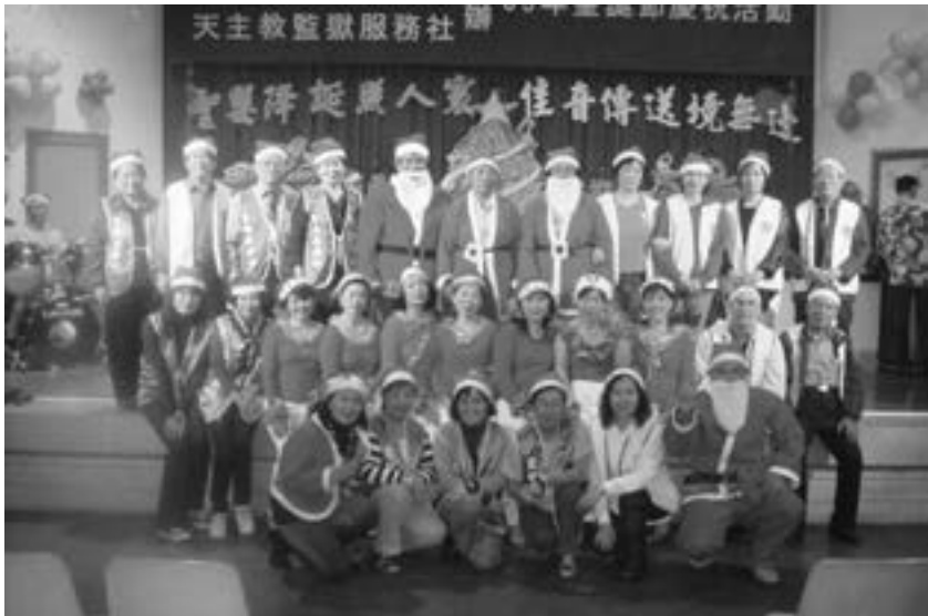
聖堂傳協志工及社區志工合影

我自民國 87 年開始，以財團法人台灣更生保護會輔導員、兼社會志工開始，進入高雄女子監獄做監獄牧靈福傳，三個人一組每周三上課一次，早上 9 點到 11 點，分成三部分、每人要事先備課；如聖經故事、影帶段落分享、聖樂教唱、生活學習經驗分享、健康教育、育兒常識及護理專業知識的教導…等，特別是我們這組有專業的護理師（長）退休。看本周要分享的內容；經常變換內容及做功課的哦！約 3 年時間，又在不同的工場做不同課程；如愛滋病友、吸毒、販毒、染毒的收容