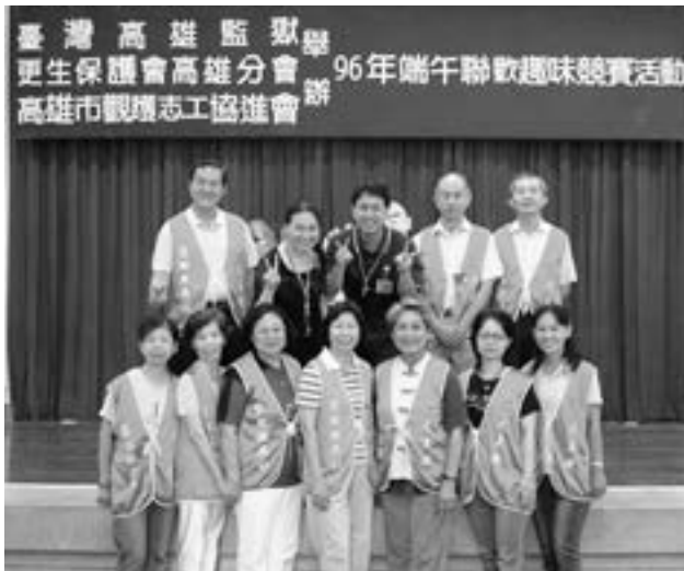
參加監所競賽活動監牧志工團隊

類，及受害的影響，對大家的接受度及了解最有收穫。還有每年的二次全國研習，由各教區輪流辦理，讓北、中、南、西、及澎湖地區的兄姊們透過聯誼，及參觀各矯正機關，對收容人的一些技藝及才能也有更深入的了解。於 108 年因疫情的關係就改由一年