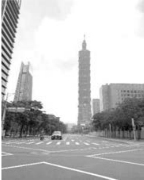
台北的天空變藍了

Coronus Virus 2019 NO DINE-IN NO GROUP STAY HOME!! 折騰到 2020 病毒帶來了地球改 變之年；2021 至今疫情 越演越烈。人類究竟作 出了甚麼改變？空氣變 清新了：我們這裡台北 的街道車水馬龍的景象 一時之間變得稀疏；101 大樓高聳入雲清晰可 見。外媒報導：傳說中 的喜瑪拉雅山，以往被 厚厚的污染物擋住，印