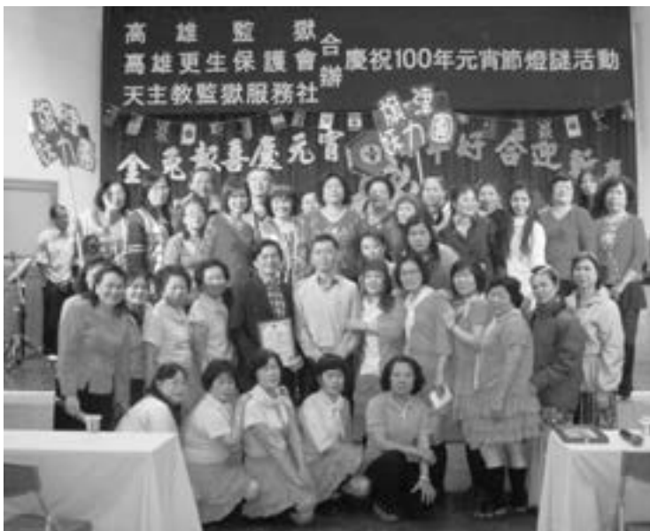
新春燈謎活動全體餐與者合影

天主教監獄服務社，大部分志工們都已年長，且青黃不接之際；需要更多的輔導老師或有特殊專長的老師們。特別是語文方面志工們，因應一些外籍勞工犯案者。隨著社會的變遷，外勞的違紀犯案，而暫時需要看管者，就需要多種外語能力的志工，可以協助翻譯，與溝通或輔導。我們暫時有一些外國神父可以協助處理，但仍是需要更多的年輕人可以來幫忙。因此；我們要再一次懇請主耶穌，以祂的大能賜福，並派遣更多的僕人來協助這一牧靈園地的成長，大家同心協力來加入社員，也可以做一些志工的安排，大家有錢出錢、有力出力的共同來努力，克服一切的困難。讓我們牧靈工作能綿延流長。阿肋路亞！感謝讚美主！阿們！✧