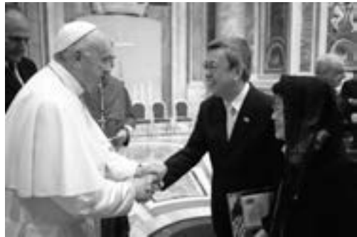
教宗方濟各接見前副總統陳建仁伉儷

教宗方濟各在 2021 年 7 月 30 日任命陳建仁博士為宗座科學院士，這是國內繼諾貝爾化學獎得主李遠哲在 2007 年獲得此一殊榮之後的第二人。陳建仁是美國約翰霍普金斯的流