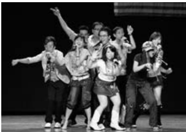
台灣第一代阿卡貝拉樂團，神秘失控人聲樂團，2006年受邀至美國巡迴演出，獲得僑界很大的迴響。

（……覺得是阿拉比卡的手足麼……）那些年，我們全台灣跑了很多學校，很多機關單位，只做一件事情：介紹阿卡貝拉。