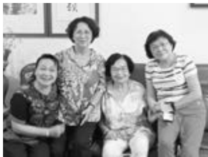
探望弟妹們於大弟春成家合影留念