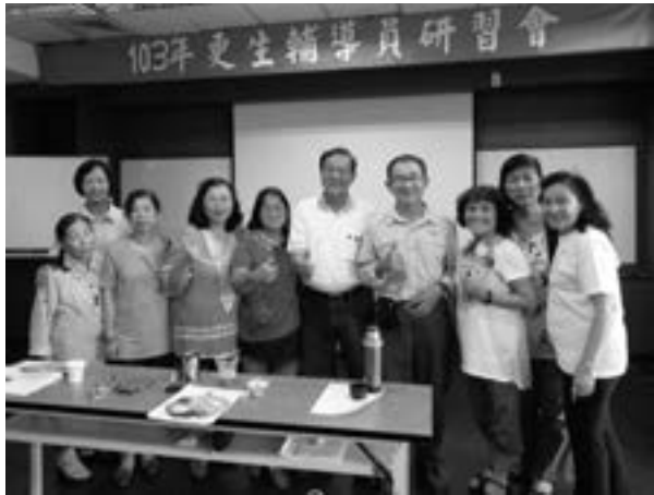
績優志工頒獎及更生輔導員研習頒獎

將近 30 年的參與陪伴；讓工作順利的推展，及課程的多样化中，大家兢兢業業的備課，將新的知識、新的技能、新的法規、及一些心得分享課程，特別是有關毒品的種