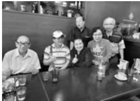
追思活動後的南北親戚聯誼

過這樣的活動大家聚一聚。相互的問候報平安，分享一些生活經驗或兒時回憶，也別有一番樂趣。隨著歲月的流逝，個個都已成七老八十的長輩囉！！時間一溜煙的轉變，已經不是往日的小孩