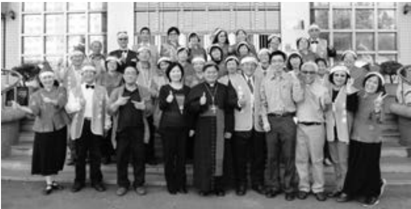
女監聖誕感恩祭及報佳音活動

我們每年都有一至二次的全國研習活動，由各教區的牧靈志工來承辦；由一位有給職的秘書長來處理社務，正式入監服務的志工，都需要有內政部的志工手冊。且要 24 小時的基本